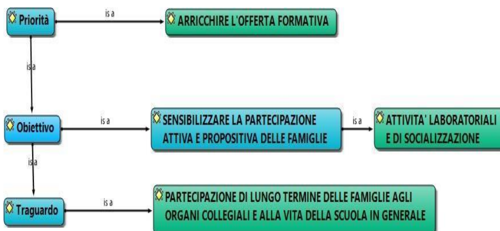
Figura 2: L'offerta formativa.

Mentre, le priorità, gli obiettivi ed i traguardi indicati in figura 2 si riferiscono all'offerta formativa in senso più ampio: